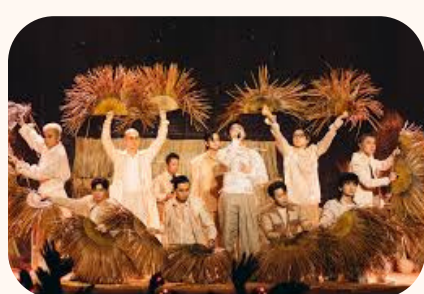
Selected by Vietnam Government to play at the 50 th Anniversary of National Reunification (Apr, 2025)